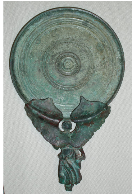
Fig 2. achterkant spiegel