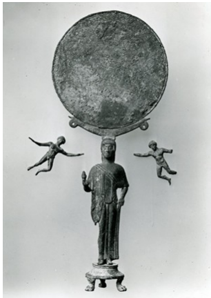
afbeelding 6: Attische Standspiegel (circa 510 VC). Online collectie van The British Museum. ( https://goo.gl/6sgR7b )