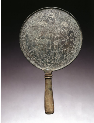
Afbeelding 5: Etruskische handspiegel (400-350VC).