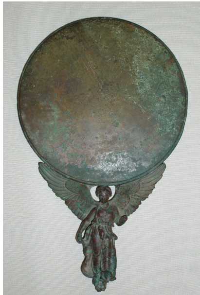
Fig 1. Voorkant Spiegel 1