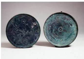
Afbeelding 7: Corinthische doosspiegel (380-350VC). Online collectie The British Museum. ( https://goo.gl/fnggVa )