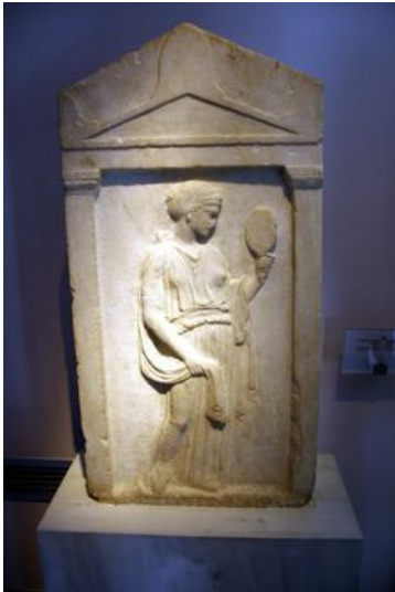
afbeelding 4: Grafstele vrouw met spiegel. (Melchior-Bonnet, S., 2001. The Mirror: A History . London: Routledge)