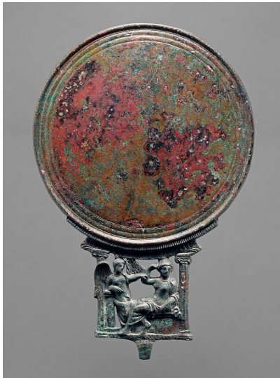
Afbeelding 8: Lokrische handspiegel (400VC). Online collectie van het Kunsthistorisches Museum Wenen. ( https://goo.gl/mB6N1w )