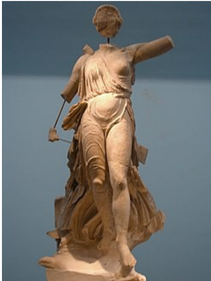
Afbeelding 1: Beeld van Athena te Olympia. ( http://www.olympia-greece.org/museum.html )