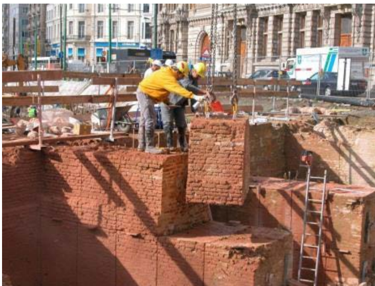
Picture 5: Stad Antwerpen, 2017. Antwerpen Morgen . [online] Available at: https://goo.gl/X4E51S