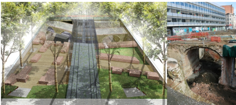
Picture 8: Noorderlijn, 2014. [online] Available at: https://goo.gl/gpk7tz in combination with "eigen materiaal"