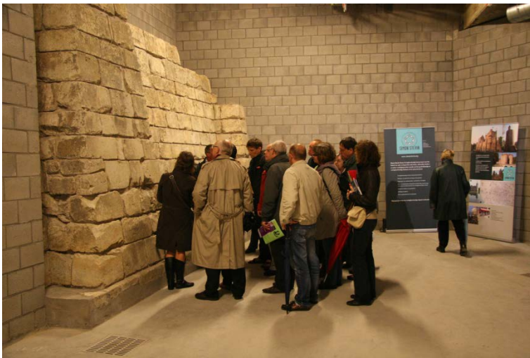
Picture 7: Stad Antwerpen, 2017. Antwerpen Morgen . [online] Available at: https://goo.gl/X4E51S