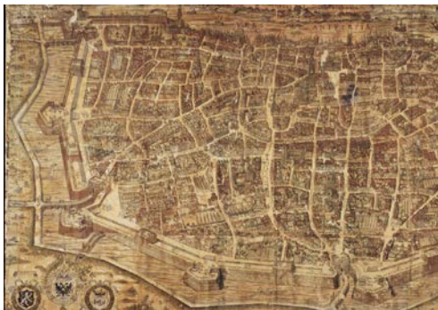
Picture 4: Bononiensis, C., 2012. Urbs Antverpia . [online] Available at: https://goo.gl/ytGrFs [Accessed 01 april 2018]. Original available at Museum Plantin-Moretus - Prentenkabinet Werelderfgoed