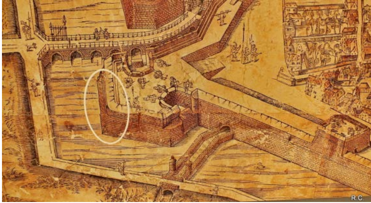
Picture 3: Stad Antwerpen, 2017. Antwerpen Morgen . [online] Available at: https://goo.gl/X4E51S